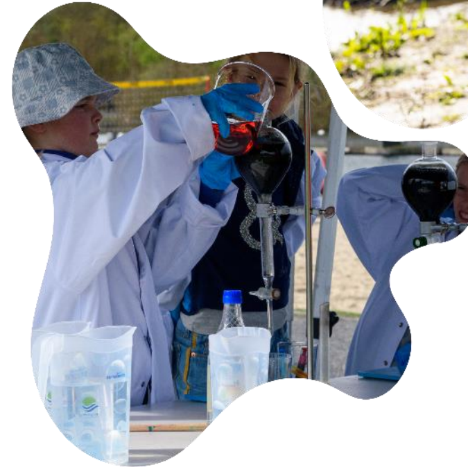
Wereldwaterdag in de Gavers